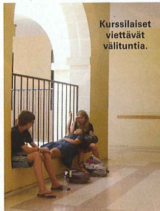
Kurssilaiset viettävät välituntia.